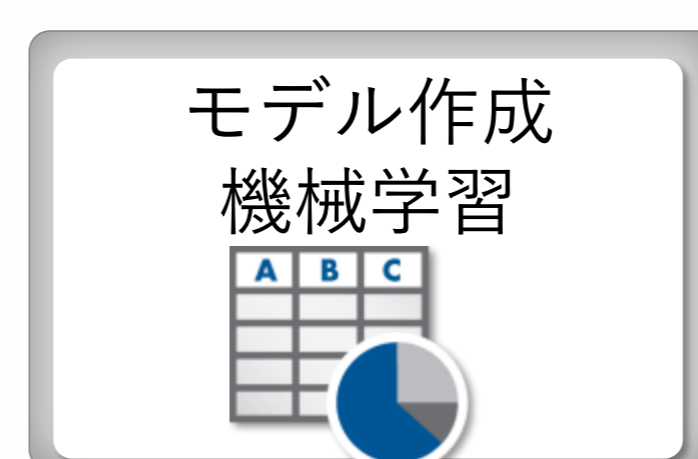
Statistics and Machine Learning Toolbox™ Deep Learning Toolbox™