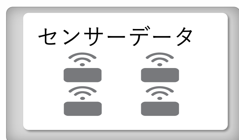
Data Acquisition Toolbox™